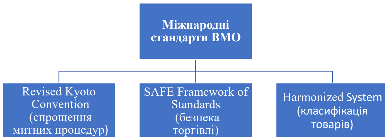
Рис. 2.1. Основні міжнародні інструменти