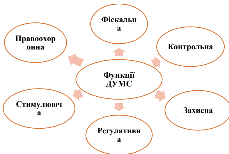
Рис. 1.1. Основні функції державного управління митною справою.

Ключову роль у забезпеченні ефективної роботи митної системи та реалізації економічної політики країни відіграють функції державного управління в митній сфері. Виконуючи ці функції, держава впливає на переміщення товарів і транспортних засобів через державний кордон, контролює зовнішньоекономічні операції, забезпечує надходження коштів до бюджету та охороняє національні економічні інтереси. Забезпечення цих завдань здійснюється через діяльність митних органів, які виступають невід'ємною частиною системи державного управління та виконують роль основного інструменту реалізації митної політики.