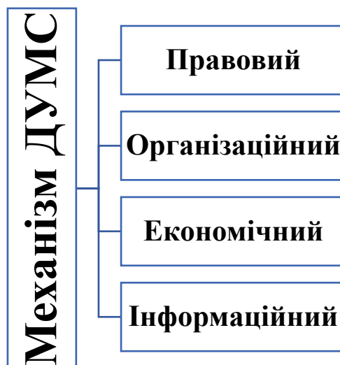
Рис. 1.3. Механізми ДУМС

адміністративних бар'єрів для суб'єктів зовнішньоекономічної діяльності (рис. 1.3.).