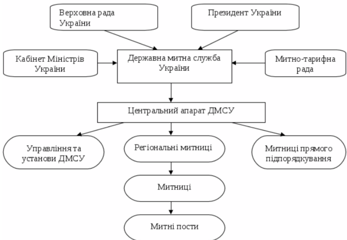
Рис.1.2 Структура Державної митної служби України [41, 7]

Організаційна структура митних органів України є багаторівневою та побудована за ієрархічним принципом. Відповідно до чинного законодавства та положень про функціонування митної служби, система митних органів включає центральний орган виконавчої влади, регіональні митниці та митні пости (Рис. 1.2).