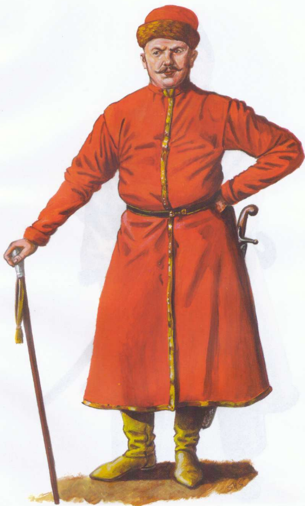
Рис. 1. Сотник Иван Березань, середина 18 ст. (автор С. Шаменков)