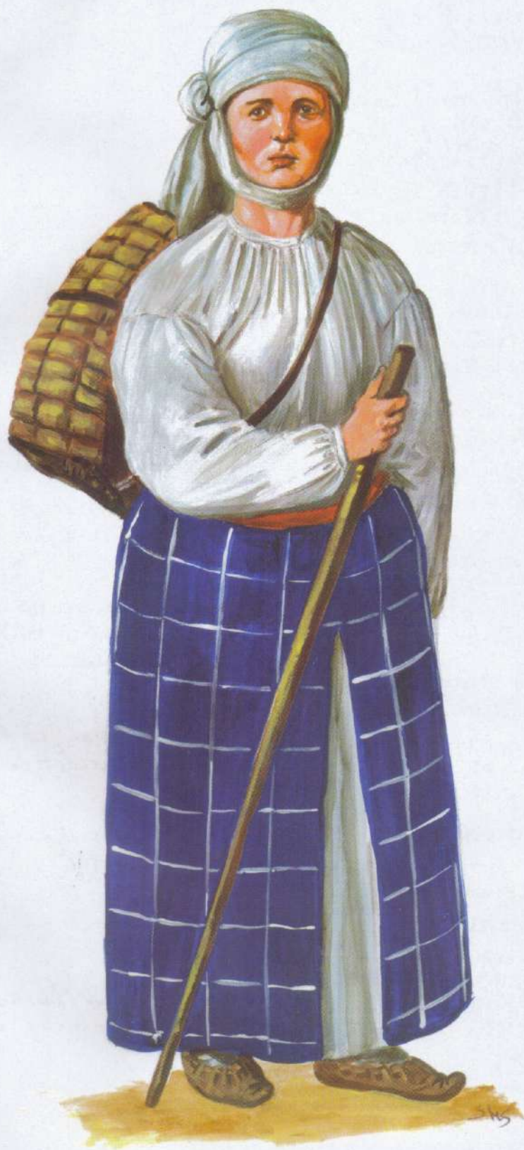
Рис. 3. Селянка Старосамарської сотні, середина 18 ст. (автор С. Шаменков)