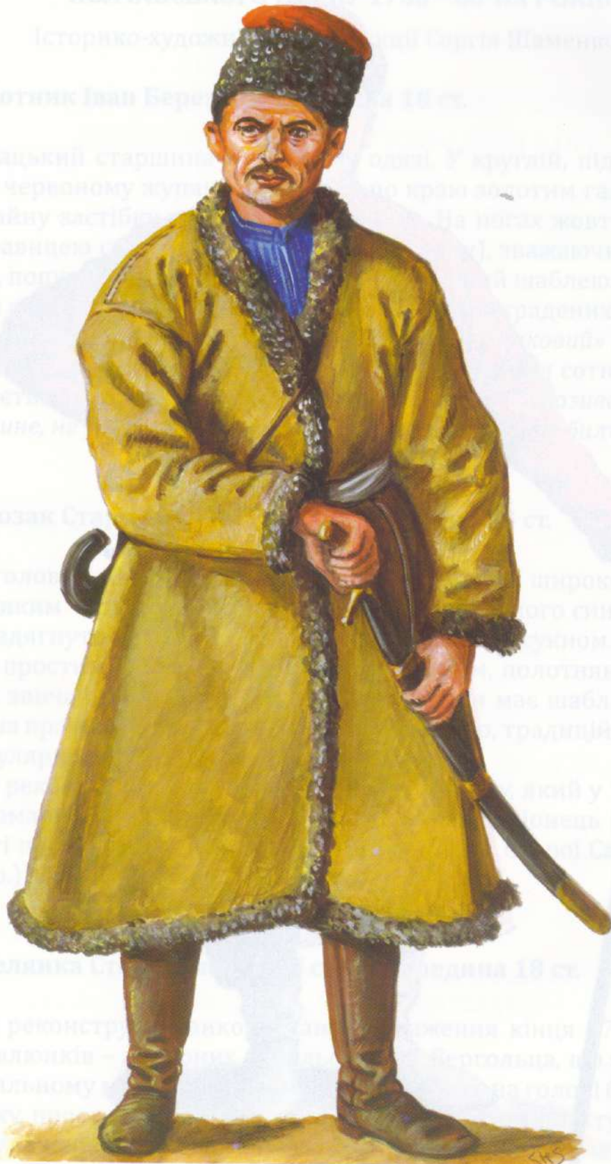
Рис. 2. Козак Старосамарської сотні, середина 18 ст. (автор С. Шаменков)

При реконструкції використано зображення кінця 1740-х років з альбому І. Яковича, який згадується в Відоносі на 1755 р. На голові білу полотняну шапку з червоною облямівкою. Підперезав червоною лямкою, через плече на мотузці висить дуб'яний плетаний кошик.