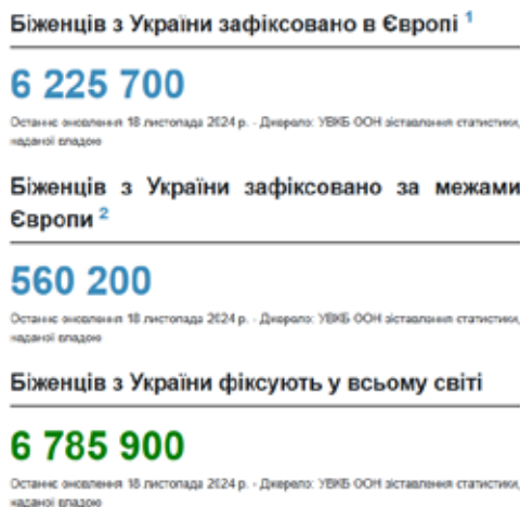
Рис. 2. Ситуація з біженцями з України станом на листопад 2024 року