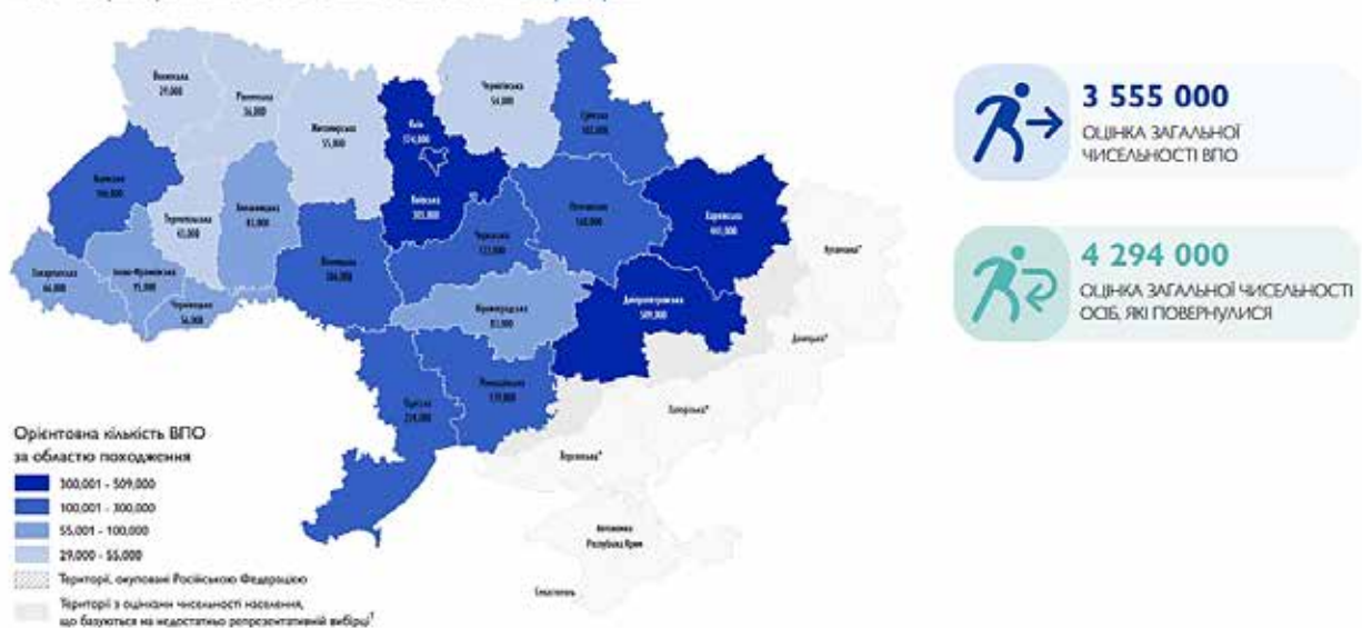
Рис. 1. Оцінка фактичної чисельності ВПО в Україні станом на жовтень 2024 року