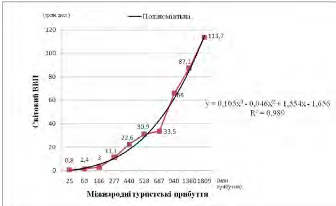
Рис. 2. Залежність кількості МТП від світового ВВП