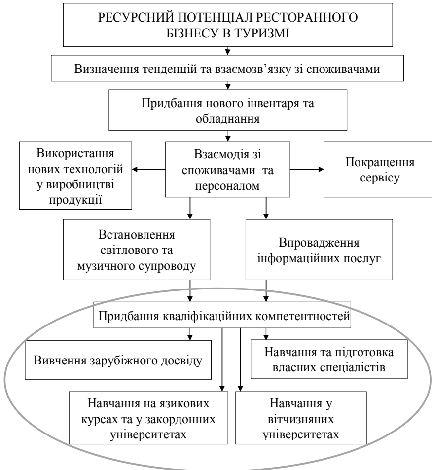
Рис. 2. Формування ресурсного потенціалу ресторанного бізнесу в туризмі, авторська розробка

Вегетаріанський напрям, як інший прояв тенденцій здорового харчування складає окремий розділ у меню. Відкриття таких спеціалізованих ресторанів вважається поки ризикованим заходом. Отримує розвиток сегмент ресторанного бізнесу пов'язаний з виїзним обслуговуванням при організації банкетів і урочистих подій у містах де немає стаціонарного ресторану або навіть мінімально обладнаної кухні.