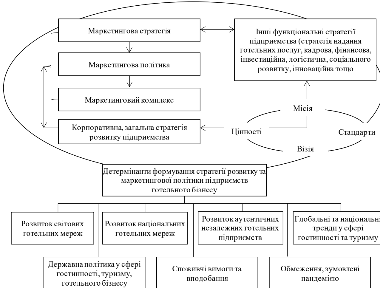
Рис. 1. Базові імперативи формування стратегії розвитку та маркетингової політики підприємств готельного бізнесу

розвитку готельного та туристичного бізнесу доцільно розглянути Індекс конкурентоспроможності країн за показниками подорожей та туризму (The Travel and Tourism Competitiveness Index (TTCI) [10].