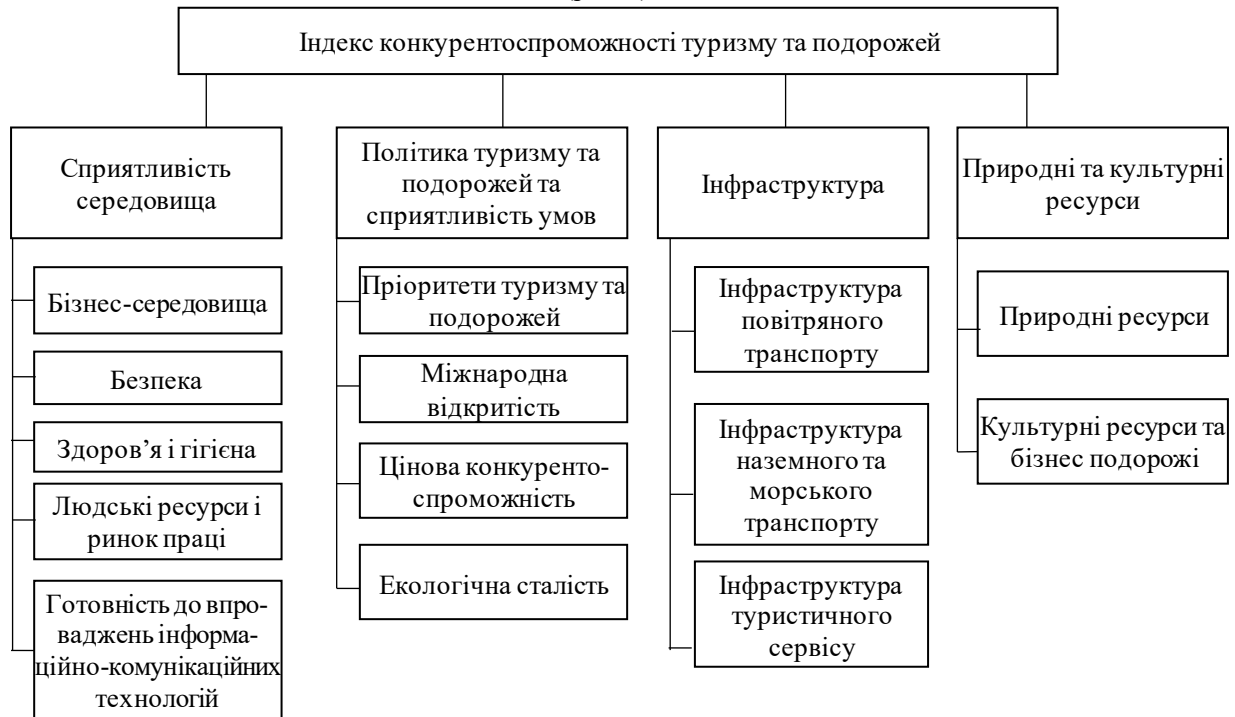
Рис. 2. Структура інтегрального індексу конкурентоспроможності туризму та подорожей [10]

інфраструктура (7 показників) визначає доступність до бізнес-центрів та туристичних пам'яток, що залежить від транспортної розв'язки, широти доріг, їх покриття, розгалуженості залізничних колій. Інфраструктура туристичних послуг (4 показники) характеризується наявністю достатньої кількості засобів для тимчасового розміщення, курортів, зокрема визначається кількістю готельних номерів, їх розміром, доступ до оренди транспортних засобів та інших додаткових послуг. Природні ресурси (5 показників) визначають туристичну привабливість країни чи регіону і характеризується, наприклад, кількістю об'єктів, що входять до Всесвітньої спадщини ЮНЕСКО, природними ландшафтами, розмаїттям фауни і флори, кількістю природних заповідників. Культурні ресурси та ділові подорожі (5 показників): кількість культурних пам'яток, включених до спадщини ЮНЕСКО, кількість стадіонів, кількість пов'язаних пошуків в Інтернеті, що характеризує рівень зацікавленості відвідувачів, кількість міжнародних зустрічей, що відбуваються в певній країні. Лідуючі позиції в рейтингу конкурентоспроможності туризму і подорожей займають Японія, Німеччина, Франція, Іспанія – 5,4 із 7 максимально можливого значення (рис. 3).