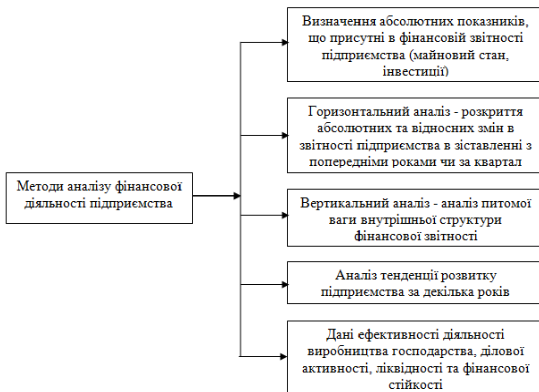
Рис. 1. Методи аналізу фінансової діяльності підприємства

Друга умова – уміння користуватись методами фінансового аналізу (рис. 1). Потрібно враховувати не тільки кількісні результати діяльності підприємства, але й якісні судження [2].