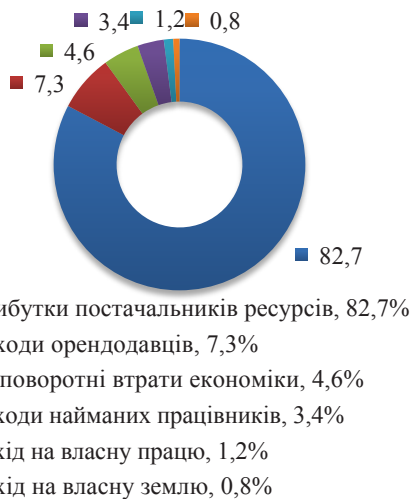
Рис. 1. Великі фермери (100–500 га)

Галузь має розвиток не завдяки, а всупереч заходам державного регулювання: трансфери від споживачів, які в результаті аграрної політики субсидуються державою, не перекривають від’ємних трансферів з інших джерел та перерозподіляються не на користь підтримки галузі.