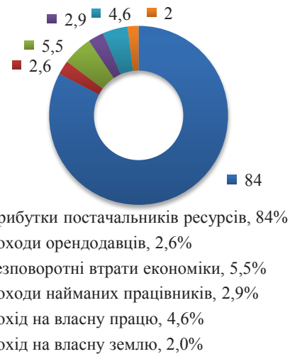
Рис. 2. Середні фермери (50–100 га)