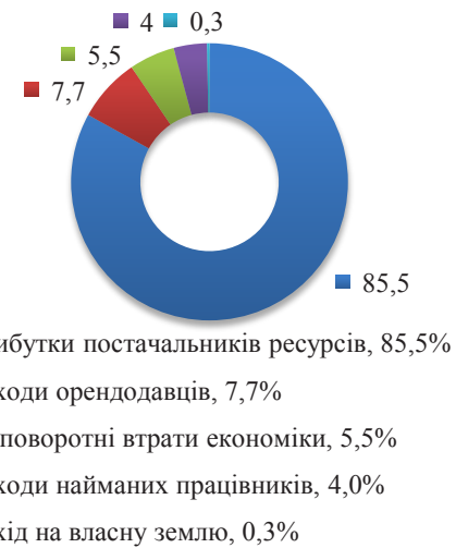
Рис. 4. Корпоративні с/г підприємства