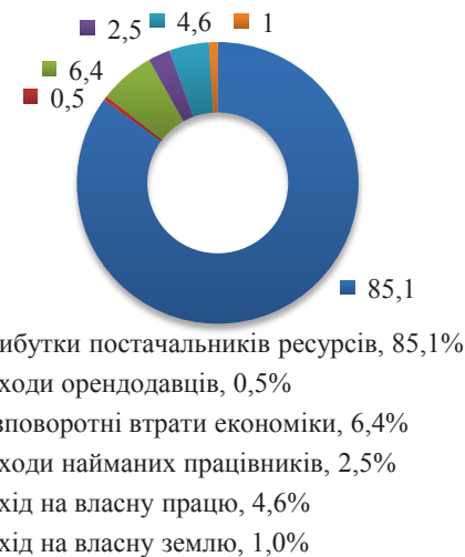
Рис. 3. Малі фермери (до 50 га)