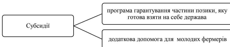
Рис. 6. Субсидювання фермерів Нідерландів

В основі сільського господарства Франції – приватні землеволодіння. І саме цій галузі приділя-