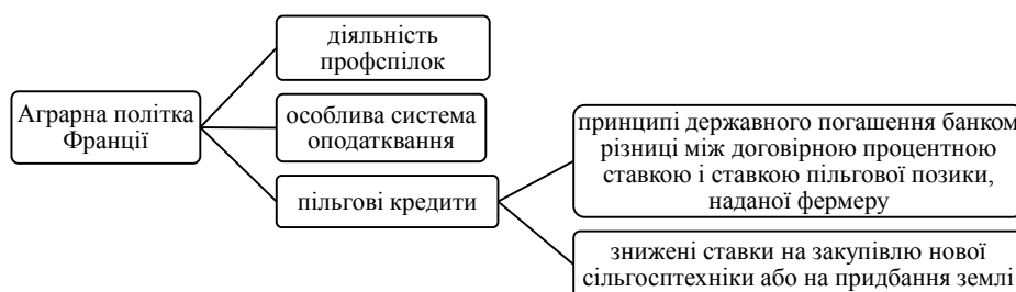
Рис. 7. Механізм аграрної політики Франції