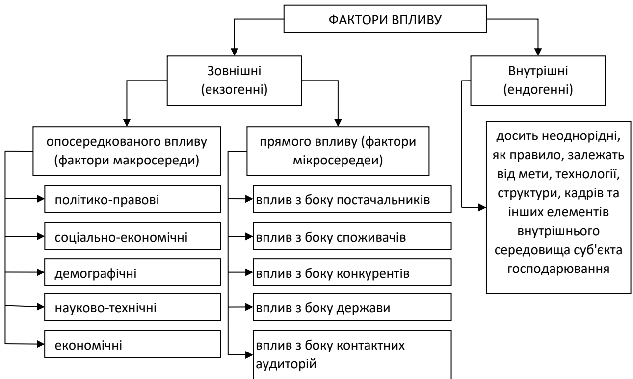
Рисунок 1. Класичний розподіл факторів впливу [5]

Об'єктивні фактори продовольчої безпеки є даністю конкретної системи, їх наявність чи відсутність, рівень сприятливості та інше не залежать від бажань та можливостей системи, що нею управляє. Не зважаючи на те, що автори [7, 9] здебільшого вважають їх практично незмінними в короткостроковому періоді та малодинамічними у довгостроковій перспективі, відзначимо, що за останні три роки світова система довела про динамічність об'єктивних факторів в короткостроковому періоді. Проте, на них дійсно неможливо впливати, але обов'язково необхідно