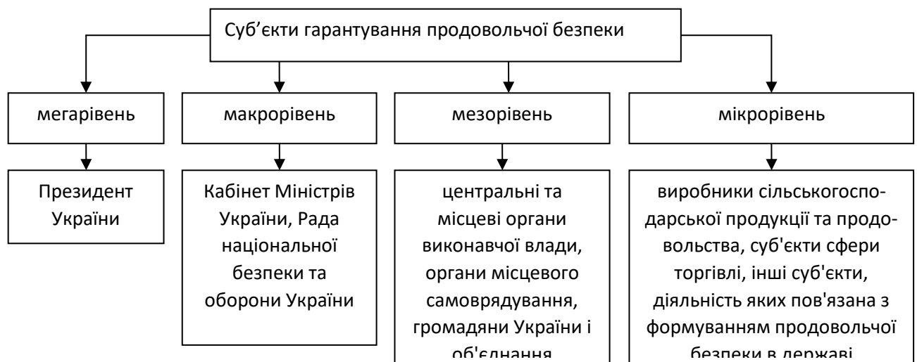
Рисунок 3. Суб'єкти гарантування продовольчої безпеки

Виходячи з Проекту Закону України «Про продовольчу безпеку України» [12], а також висновку про необхідність розглядати вплив факторів на продовольчу безпеку в залежності від рівня системи [8], суб'єкти гарантування, а значить і впливу на продовольчу безпеку, які можуть керувати факторами зовнішнього впливу представлені на рис. 3.