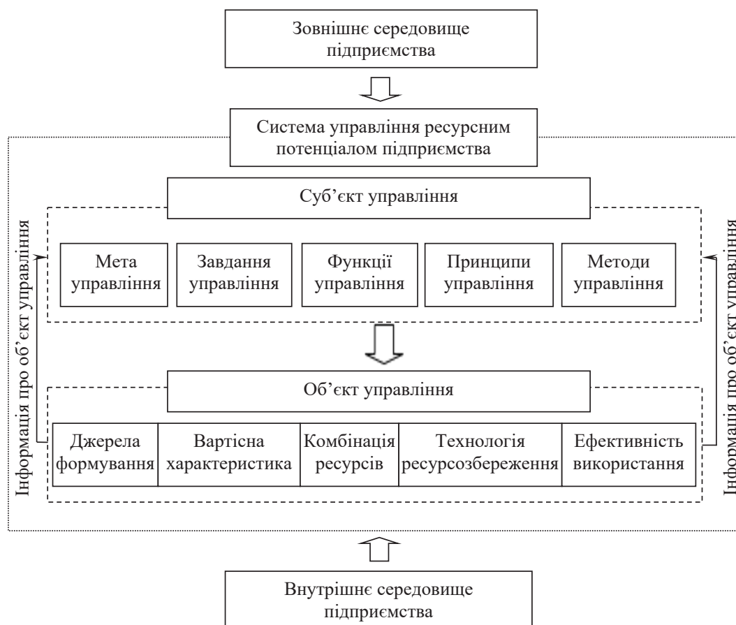
Рис. 1. Система управління ресурсним потенціалом підприємства

Розглянемо детальніше складові елементи системи управління ресурсним потенціалом підприємства, зокрема ті, що формують основу організаційно-економічного механізму управління, який забезпечує дієвий вплив на фактори, стан яких обу-