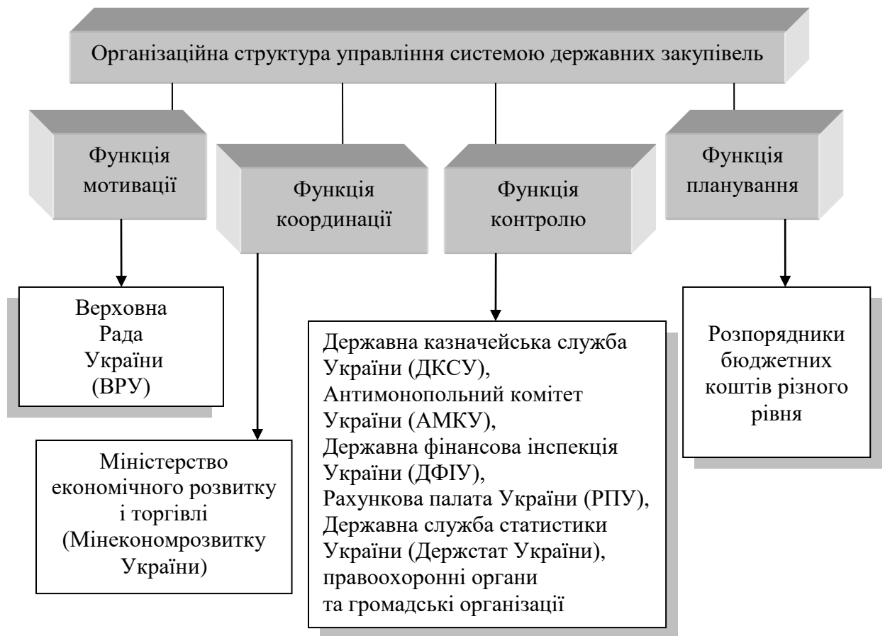
Рис. 2.2. Функціональний підхід до розкриття сутності організаційної структури інституціонального механізму державного управління системою державних закупівель

Функціональний та суб'єктний поділ організаційної структури управління у системі державних закупівель відображено на рис. 2: