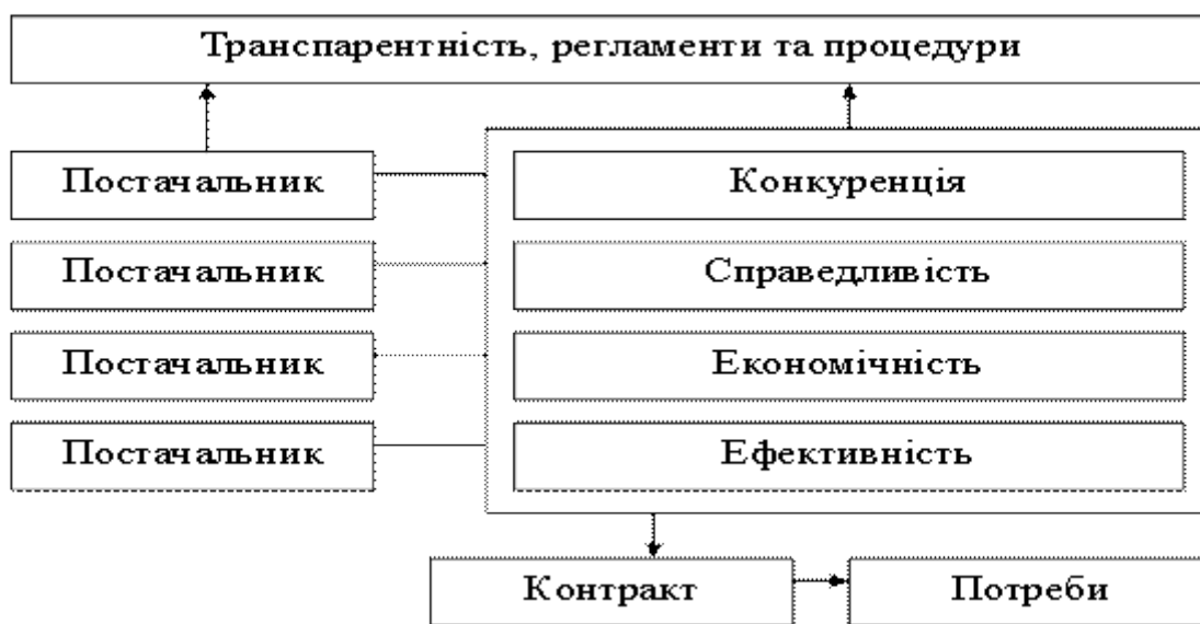
Рис. 1. Основні принципи прок’юремента

Організація державною системи розміщення замовлення (для державних, регіональних, корпоративних потреб) повинна бути пов’язана з принципами прок’юремента (англ. – procurement). Загальноприйняті принципи прок’юремента встановлені такими міжнародними документами, як, Угода про державні закупівлі в рамках Всесвітньої торгової організації, документами та директивами країн-учасниць ЄС (рис. 1).