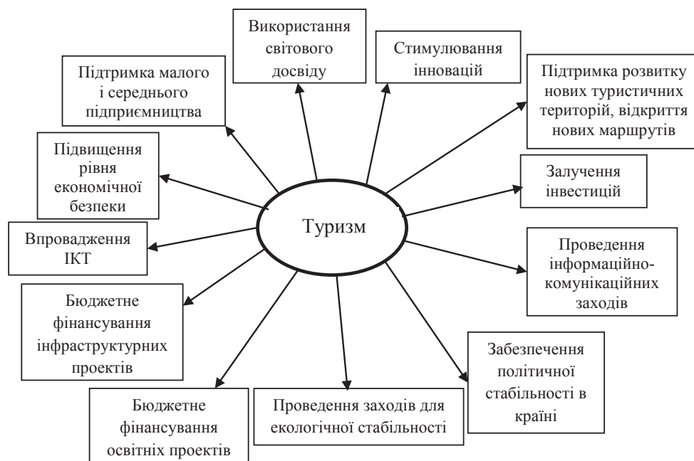
Рис. 2. Напрями вдосконалення державної політики в сфері туризму

Для того, щоб туристу захотілося приїхати та відвідати українські міста і регіони, необхідно привести у відповідність світовим стандартам дорожньо-транспортну інфраструктуру, готелі, облаштувати історичні та інші пам'ятки, а також підвищити професіоналізм кадрового складу галузі шляхом проведення різних