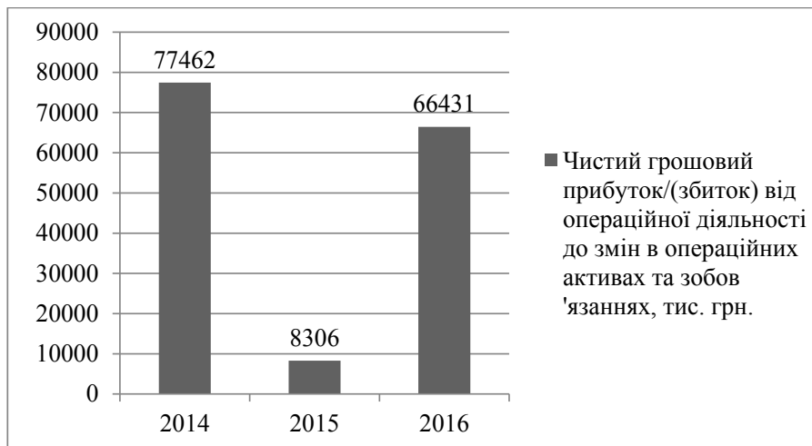
Рис. 4. Динаміка чистого грошового прибутку від операційної діяльності до змін в операційних активах та зобов'язаннях АТ «Сбербанк» у 2014-2016 рр. [5]

Висновки. Проведене дослідження дозволяє зробити наступні висновки: фінансовий стан – це складна, інтегрована за багатьма показниками характеристика діяльності підприємства в певному періоді, що відображає ступінь забезпеченості підприємства фінансовими ресурсами, раціональності їх розміщення, забезпеченості власними оборотними коштами для своєчасного проведення грошових розрахунків за своїми зобов'язаннями та здійснення ефективної господарської діяльності в майбутньому. До завдань, що вирішуються в процесі оцінювання фінансового стану, слід віднести дослідження показників, отриманих в результаті його аналізу, з точки зору відповідності їх фактичних значень нормальним для даного підприємства рівням, ідентифікацію факторів,