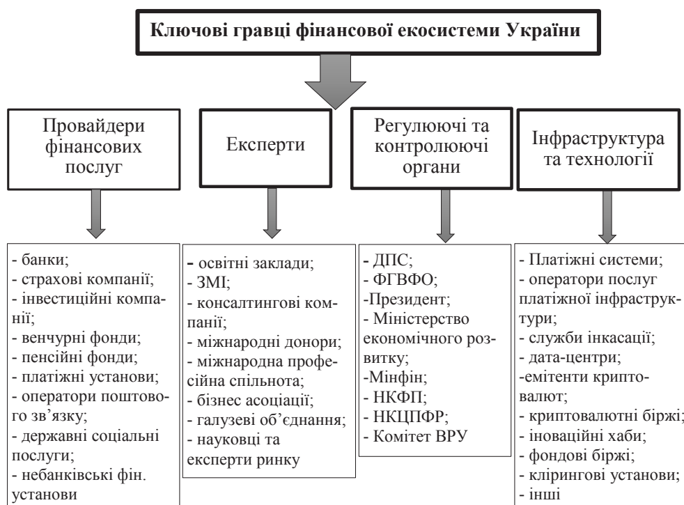
Рис. 3. Ключові гравці фінансової екосистеми України [15]

Наступним кроком до легалізації криптоактивів стало створення в березні 2020 року Міністерством цифрової трансформації України профільної робочої групи, яка повинна до кінця 2020 року розробити проект закону «Про регулювання обігу віртуальних активів». До складу групи увійшли понад двадцять організацій, в тому числі і недержавних, які нині мають справу з