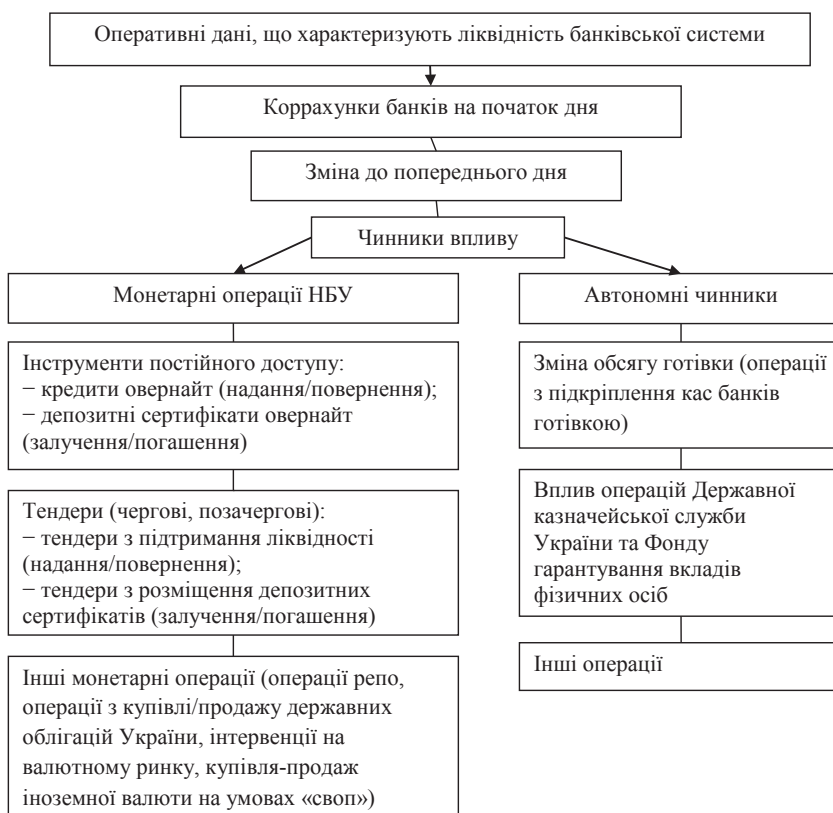
Рис. 1. Оперативні дані, що характеризують ліквідність банківської системи України

Розгляд основних показників ліквідності банківської системи, наведених в макроекономічному та монетарному огляді, що публікується щомісячно Національним банком України, свідчить, що особливо значні монетарні диспропорції спостерігалися в першому – третьому кварталах 2016, 2017, 2018 років. У ці періоди залишки коштів за депозитними сертифікатами значно перевищують залишки коштів на коррахунках банків, водночас зазначимо, що ці тенденції з роками дещо згладжуються і в 2018 році вони менш виражені, ніж в 2016 році. Крім того, кожного року приблизно в кінці третього – четвертому кварталі року показники ліквідності знижуються, в основному зав-