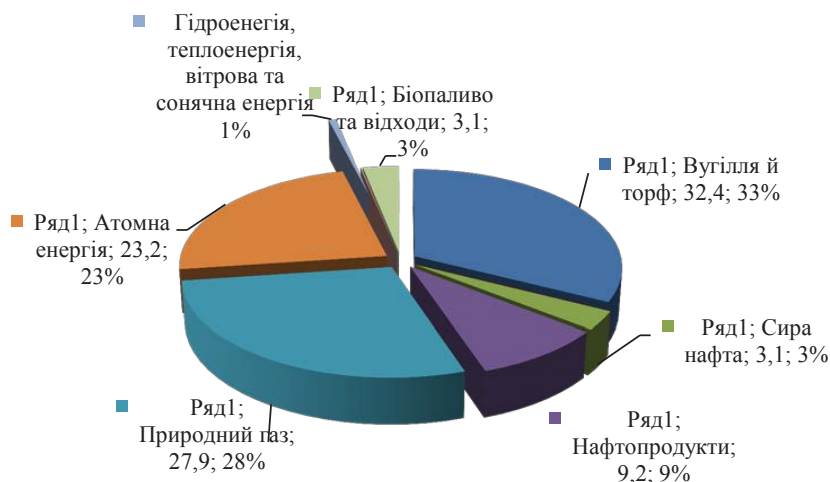
Рис. 1. Структура первинної енергії у 2016 р.

є, з одного боку, найбільшими споживачами паливно-енергетичних ресурсів, а з іншого – основою української економіки та забезпечують лівову частку ВВП країни. Тому в цих секторах промисловості заходи з енергозбереження є першочерговими.