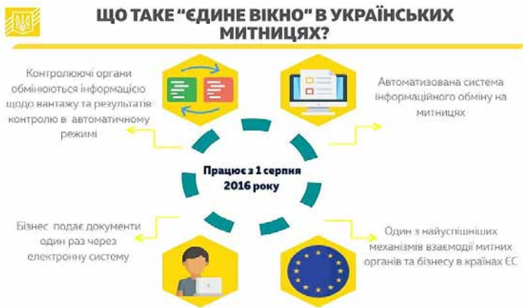
Рис. 1. Інфографіка щодо фундаментальних положень організації контролю за принципом «єдиного вікна» в Україні [12]

За допомогою ІТ-системи в українській версії «єдиного вікна» забезпечено функцію з електронного обміну даними та створено передумови для запровадження безпаперового середовища для комунікації учасників зовнішньої торгівлі із контролюючими органами. Програмно-інформаційний комплекс «Єдине вікно» реалізований у вигляді модулю автоматизованої системи митного оформлення «Інспектор». Основною проблемою функціонування системи «єдиного вікна» в Україні залишається великий дисонанс у рівнях розвитку інформаційних технологій автоматизації митних процедур порівняно із процедурами інших контролюючих органів. Тому нині програмно-інформаційний комплекс «Єдине вікно» АСМО «Інспектор» для користувачів – контролюючих органів є інтерфейсом для інформаційного обміну та зберігання даних. А отже, автоматизація процедур контролюючих органів, зокрема надання послуг із видачі дозвільних документів міжнародного зразка, іще потребує розробки.