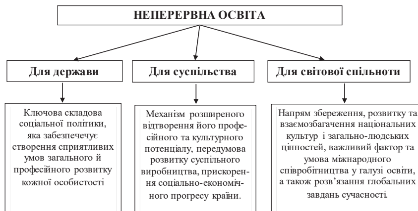
Рис. 1. Роль неперервної освіти у державному та світовому просторі.

Розглянемо детальніше роль неперервної освіти у державному та світовому просторі (рис. 1).