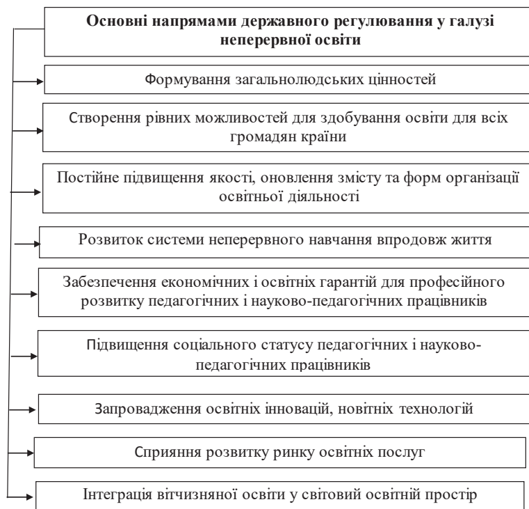
Рис. 4. Основні напрями державного регулювання у галузі освіти

На рисунку 4 представлено основні напрями державного регулювання у галузі неперервної освіти, а саме: формування загальнолюдських цінностей; створення рівних можливостей для здобування освіти; підвищення якості, оновлення змісту та форм організації освітньої діяльності; розвиток системи неперервного навчання впродовж життя; забезпечення економічних і освітніх гарантій для професійного розвитку педагогічних і науково-педагогічних працівників; підвищення соціального статусу педагогічних і науково-педагогічних працівників; запровадження освітніх інновацій, новітніх технологій; сприяння розвитку ринку освітніх послуг; інтеграція вітчизняної освіти у світовий освітній простір.