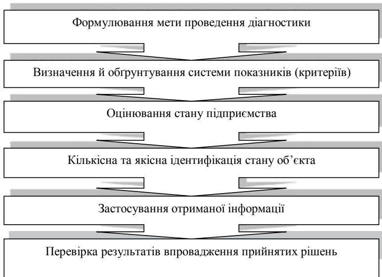
Рис. 2. Етапи діагностики підприємства