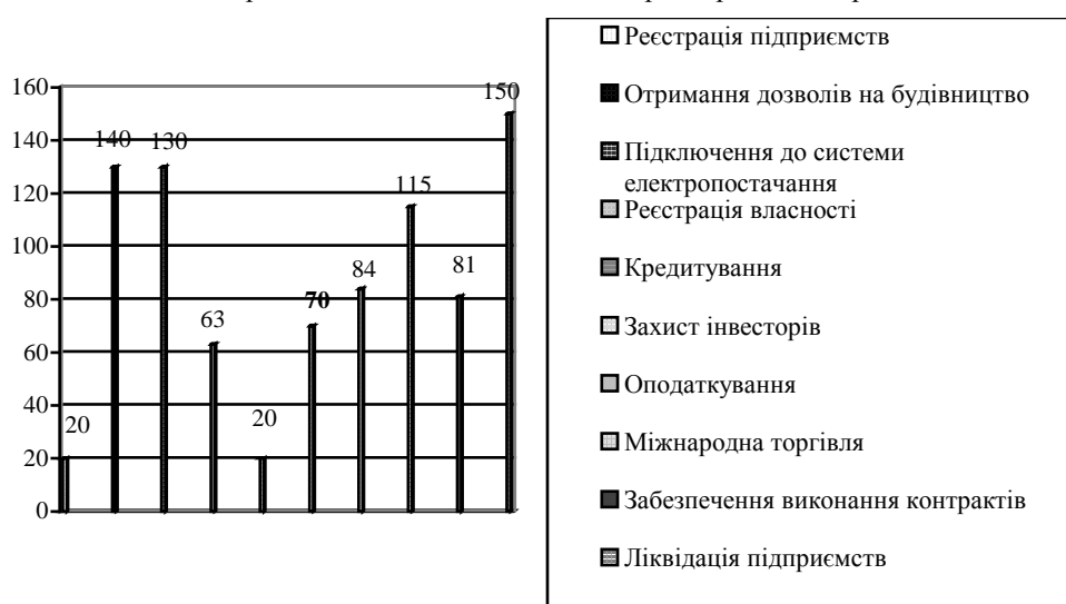
Рис. 3. Показник ведення бізнесу (ПВБ) в Україні за 2017 р.

Основні індикатори даного дослідження за 2017 р. зображено на рис. 3.