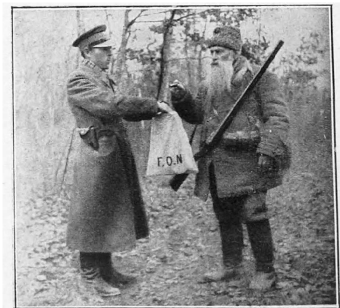
Рис. 2. Передача мисливцем гільз у фонд народної оборони Джерело: [1].

Метал, з якого виготовляли зброю, Польща взагалі не виробляла. Для мисливців це не спричиняло труднощів, оскільки до цього часу всі використані гільзи викидали на смітник або їх збирали хлопці з нагінки, щоб продати браконьерам або торговцям-євреям [1, 65–67]. Останні навіть влаштували собі успішний бізнес: купували всі запропоновані гільзи, сортували відповідно до калібру і продавали. Нова гільза коштувала 15 грошів, а стріляна – лише 2–3 гроші, проте кожна містила 2 грами чистої міді. Якщо рахувати, що в середньому кожен мисливець щороку купує 200 набоїв, а мисливців у Польщі було на той час 50 тис., то вони витрачали 10 млн патронів, тобто 20 т міді [2, 216–218]. Слід додати, у довоєнній Польщі був дуже поширений стрілецький спорт, а на стрільбищах використовували дуже багато набоїв, що становило ще додаткових 50 %.