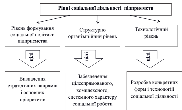
Рис. 2. Рівні соціальної діяльності підприємств