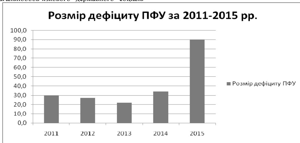
Рис. 2. Аналіз динаміки дефіциту Пенсійного фонду України у період з 2011 по 2015 роки

ного страхування, у тому 291 числі Пенсійного фонду України. Проте, незважаючи на це, бюджет ПФУ і досі залишається дефіцитним (рис.2).