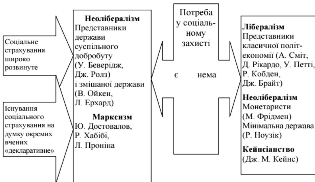
Рис. 1. Групування економічних шкіл за поглядами щодо потреби в соціальному захисті та соціальному страхуванні

економічних систем він характерний, адже доволі часто науковці стверджують, що таке явище властиве лише ринковій економіці. Погляди вчених-економістів у цьому питанні можна розподілити за критерієм існування або відсутності потреби в соціальному захисті. На нашу думку, доцільно виокремити школи лібералізму (класична, неокласична течія, марженалізм, монетаризм) та дирижизму (кейнсіанство, неокейнсіанство), представники яких ставлять під сумнів потребу державного втручання у сфері економічного й соціального життя суспільства. З іншого боку, існують школи марксизму і неолибералізму (змішана держава, держава суспільного добробуту), дослідники яких, навпаки, вважають процеси втручання держави у соціальну сферу не лише необхідними, а й бажаними. Суттєва різниця між ними полягає в тому, що в умовах реалізації політики марксизму існування соціального страхування є більш декларативним, а в умовах побудови соціально орієнтованої (змішаної) держави, навпаки, страхуванню відводиться основна роль (рис. 1).