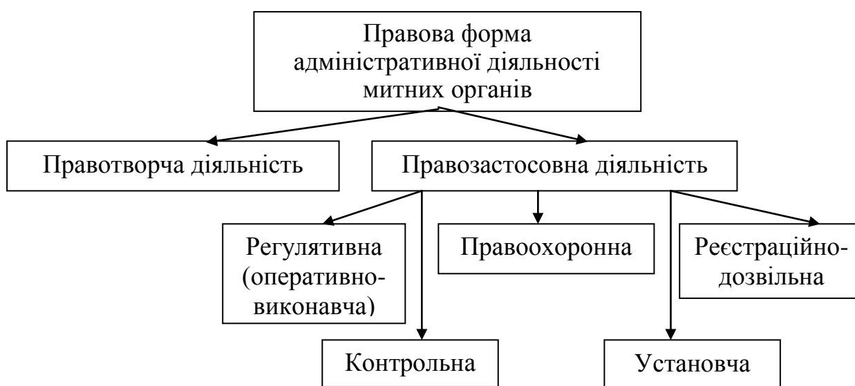
Рис. 2. Структура правової форми адміністративної діяльності митних органів

Безумовно, використання вже існуючих класифікацій форм діяльності державних органів вимагає врахування специфіки діяльності, яку здійснюють митні органи, беручи участь у формуванні митної політики та безпосередньо її реалізуючи. На нашу думку, найбільше значення для подальшого вдосконалення митного законодавства, що регулює суспільні відносини у митно-правовій сфері та практику його застосування, має класифікація правових форм адміністративної діяльності митних органів (рис. 2):