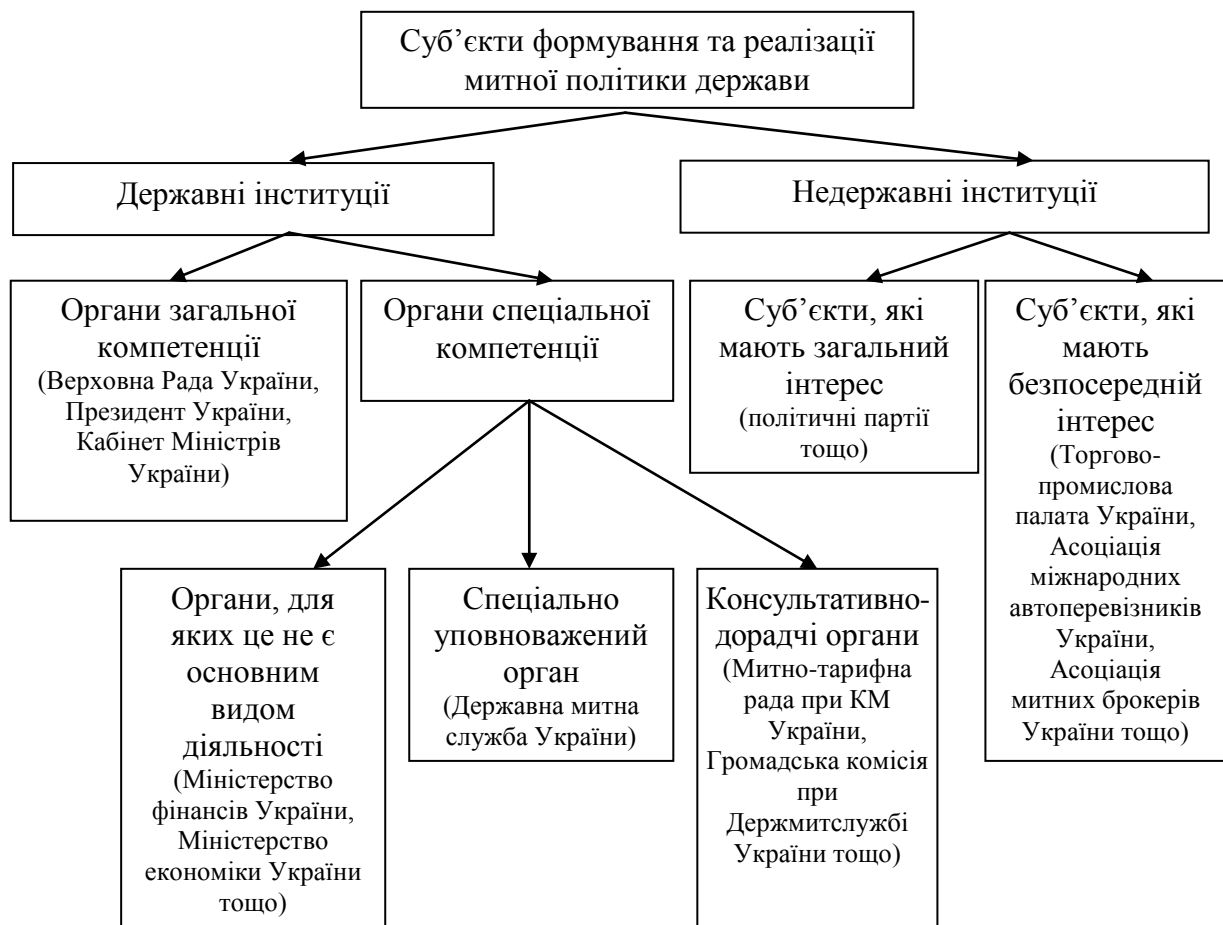
Рис. 1. Структура інституціонального механізму формування та реалізації митної політики

Свої функції щодо формування митної політики ВР України здійснює шляхом законотворчої діяльності, результатом якої є створення нормативно-правової основи для діяльності усіх суб'єктів та об'єктів митної політики. Тобто основною функцією парламенту України у формуванні та реалізації митної політики є її законодавче забезпечення.