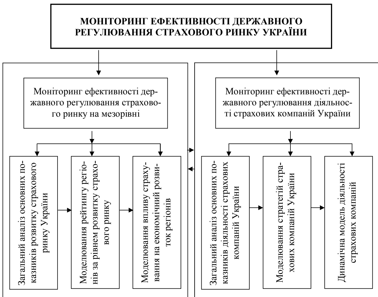
Рис. 2. Комплексна система моделей для дослідження розвитку страхового ринку України

Для моніторингу ефективності державного регулювання страхового ринку пропонується комплексна система моделей, яка представлена на рис. 2.