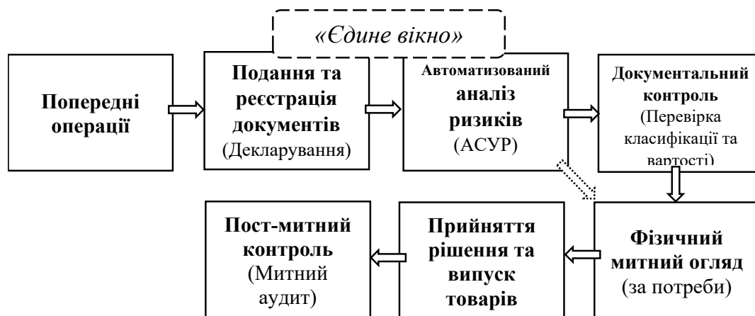
Рис. 1.1. Етапи здійснення митного контролю товарів та транспортних засобів