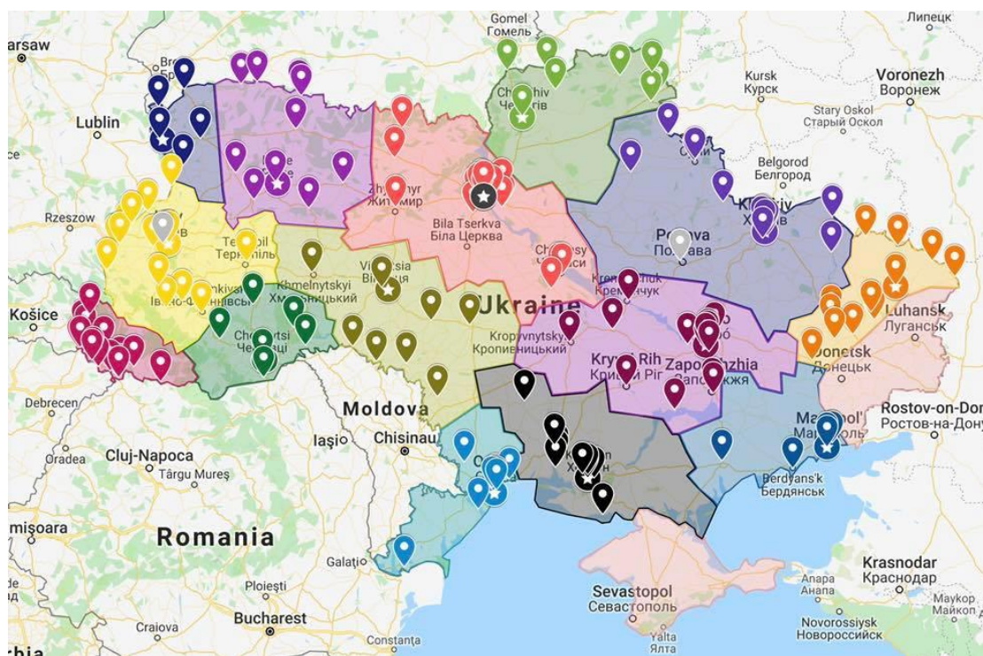
Рис.1.2. Мапа розміщення митних постів в територіальних органах Держмитслужби станом на 2 жовтня 2019 року [26]