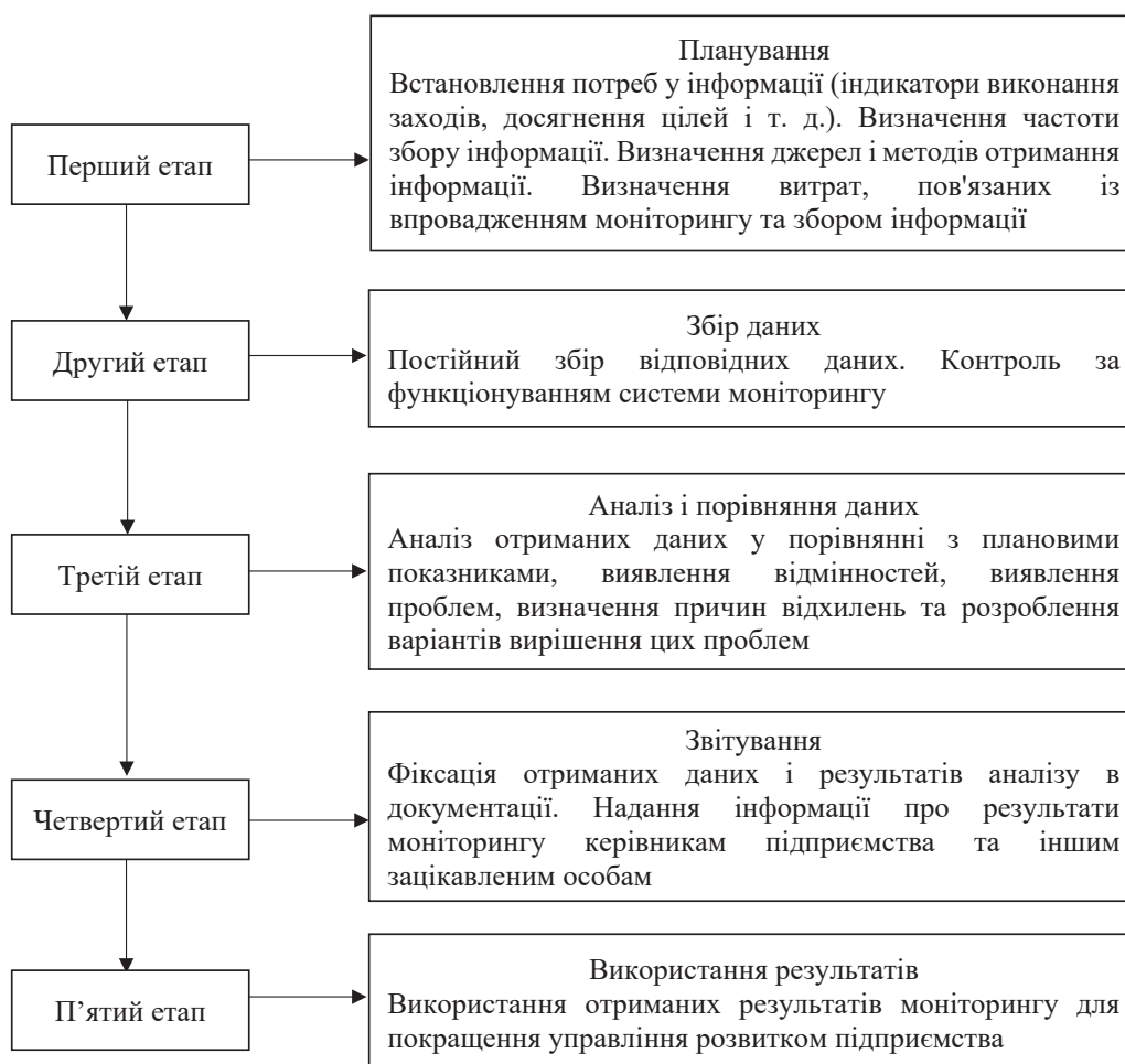
Рис. 1. Етапи організації моніторингу в системі управління розвитком підприємства

Проведення моніторингу сталого розвитку підприємства вимагає урахування специфіки й індиві-