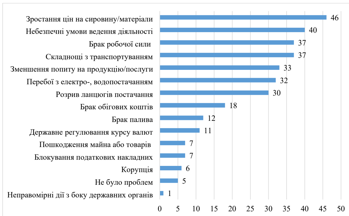
Рис. 2. Основні перешкоди для ведення бізнесу у воєнний час станом на вересень 2023 року, % респондентів