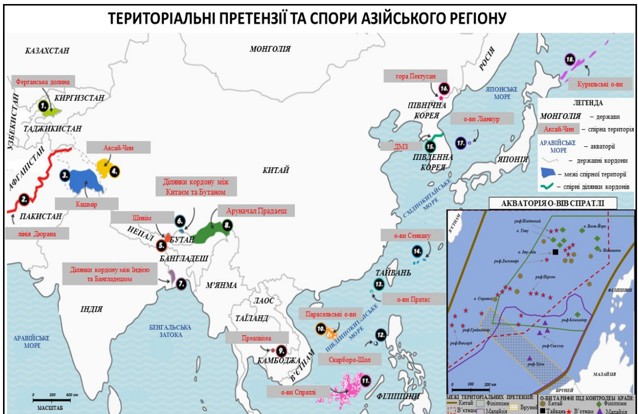
Рис. 2. Карта територіальних суперечок Центральної, Східної, Південно-Східної Азії (складено автором за [6, 10, 11, 12])

Найбільшим осередком є азійський регіон, що має близько 45 % суперечок від загальної кількості. У табл.1 відображені найбільш відомі та проблемні для світової спільноти територіальні спори у межах Азії (рис.2).