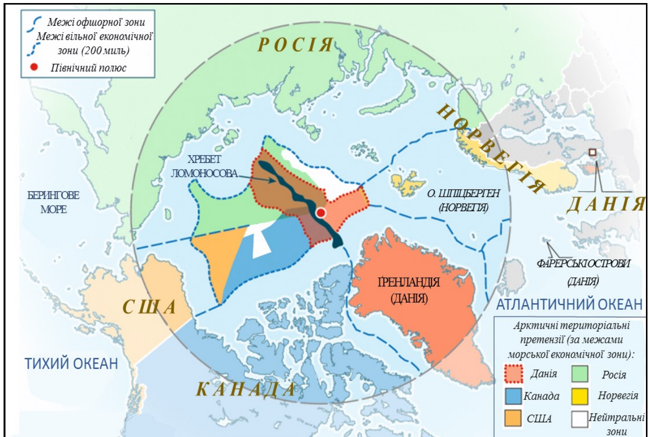
Рис. 3. Карта територіальних претензій та спорів арктичного регіону (складено за [7, 16])

Особливий правовий статус і особливе місце на політичній карті мають території Арктики та Антарктиди, а отже територіальні претензії щодо цих регіонів розглядаються інакше, відповідно до загальноприйнятих норм міжнародного права (рис.3) [7].