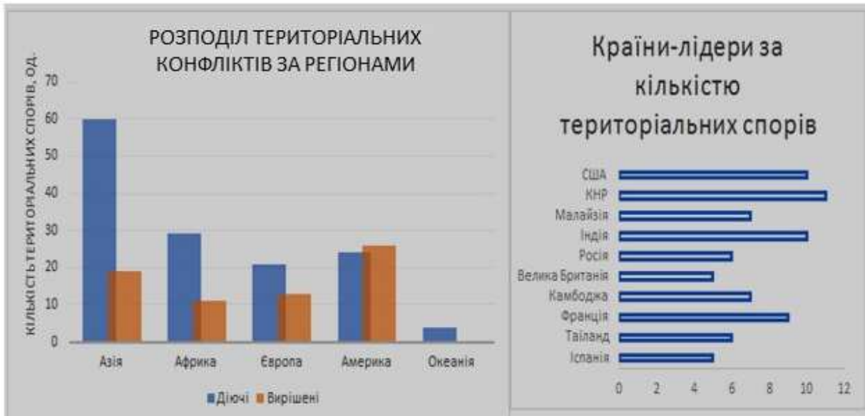
Рис. 1. Кількість діючих та вирішених територіальних спорів у регіонах та країнах світу (складено за [10,11,12])

Найбільшим осередком є азійський регіон, що має близько 45 % суперечок від загальної кількості. У табл.1 відображені найбільш відомі та проблемні для світової спільноти територіальні спори у межах Азії (рис.2).