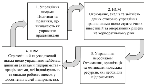
Рис. 1. Взаємозв'язок концепцій управління працівниками HCM та HRM [авторська розробка]