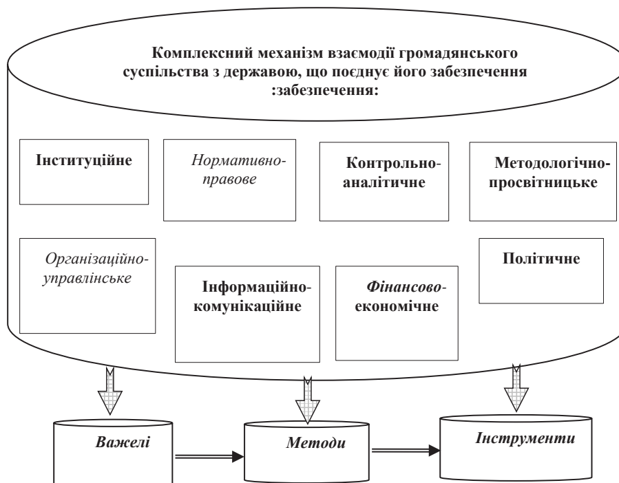
Рис. 2. Комплексний механізм формування, функціонування та розвитку взаємодії ГО та владних інституцій

У науковій літературі [2; 5; 16; 17] є усталені підходи до висвітлення механізмів державного управління, що забезпечують реалізацію цілей державного управління. Необхідною умовою ефективності діяльності інституцій публічного управління у напрямі формування, функціонування та розвитку ГО є повне забезпечення цієї діяльності дієвими механізмами за різними напрямками починаючи від інституційного до методологічно-просвітницького та політичного. Загалом забезпечення взаємодії ГО з владними інституціями доцільно об'єднати у єдиний комплексний механізм структура якого може бути представлена у наступному вигляді (рис. 2).