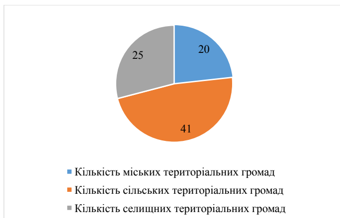
Рис. 2. Загальні кількісні показники територіальних громад Дніпропетровської області за типами громад

В Дніпропетровській області утворено 86 територіальних громад.