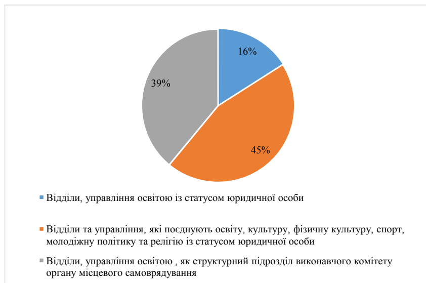
Рис. 5. Відсоткові показники за типами органів управління освітою в громадах Дніпропетровської області

Аналіз створених органів управління освітою в громадах (рис.4) показує, що в 53 громадах створено органи управління освітою із статусом юридичної особи, із них в 14 громадах створено відділи або управління, які опікуються тільки освітньою галуззю, а в 39 громадах – відділи або управління, які поєднують освіту, культуру, фізичну культуру, спорт, молодіжну політику та релігію.