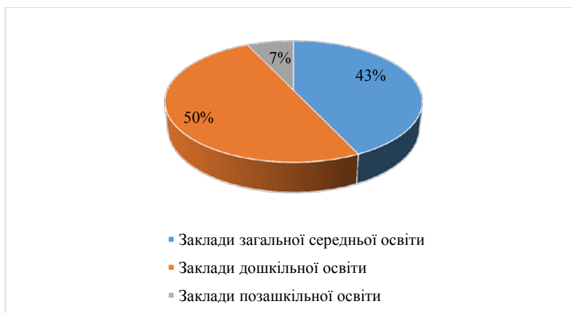
Рис. 6. Відсоткові показники системи освіти Дніпропетровської області

Відсоткові показники системи освіти вказують, що 50% всіх закладів складають заклади дошкільної освіти, 43% – заклади загальної середньої освіти і 7% – заклади позашкільної освіти (рис. 6).