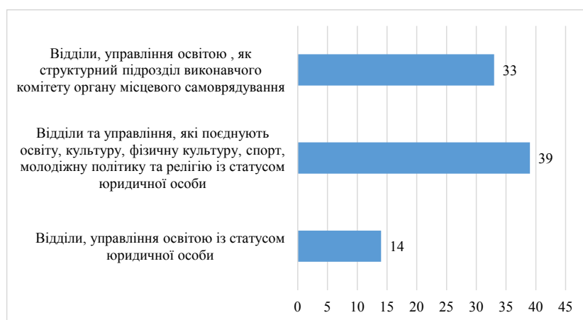
Рис. 4. Кількісні показники за типами органів управління освітою в Дніпропетровській області

В 86 громадах Дніпропетровської області створені органи управління освітою з урахуванням потенціалу та фінансової спроможності громади.