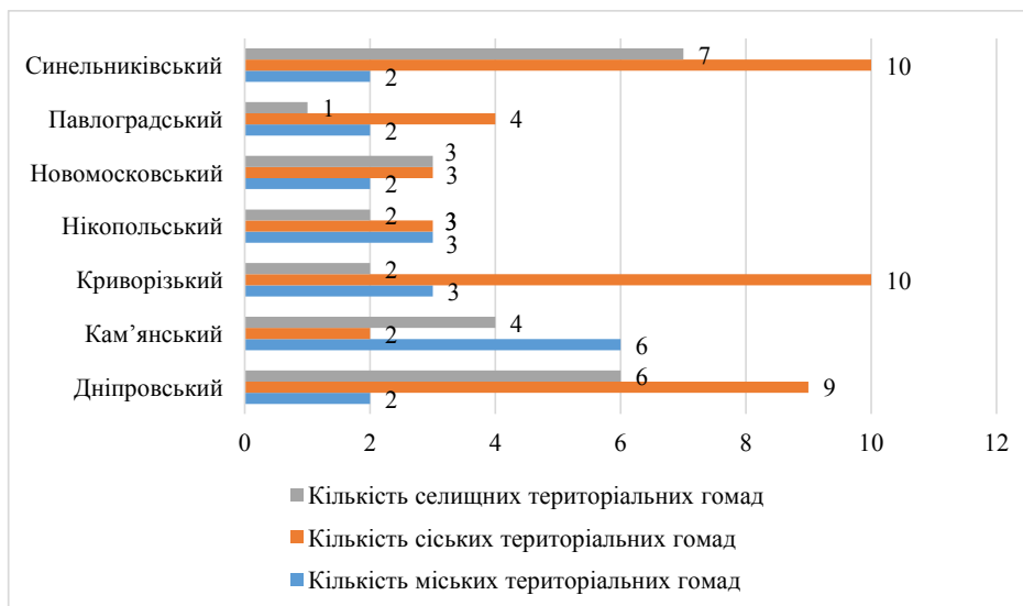
Рис. 3. Кількісні показники територіальних громад у межах районів Дніпропетровської області

В Дніпропетровській області утворено 7 районів – адміністративно- територіальних одиниць верхнього рівня. Кількісні показники територіальних громад у межах районів за типами показують, що питома вага громад припадає на Синельниківський район – 19 територіальних громад, Дніпровський район – 17 територіальних громад та Криворізький район – 15 територіальних громад (Рис. 3).