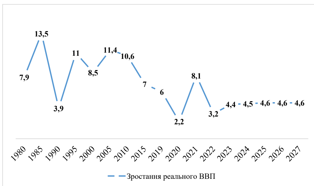
Рис. 1. Реальне річне зростання ВВП Китаю, 1980–2022 рр. і прогноз до 2027 р.

Порівняємо частки Китаю та США у світовому ВВП за ПКС (паритетом купівельної спроможності). Так, частка Китаю зросла з 2,3% у 1980 р.