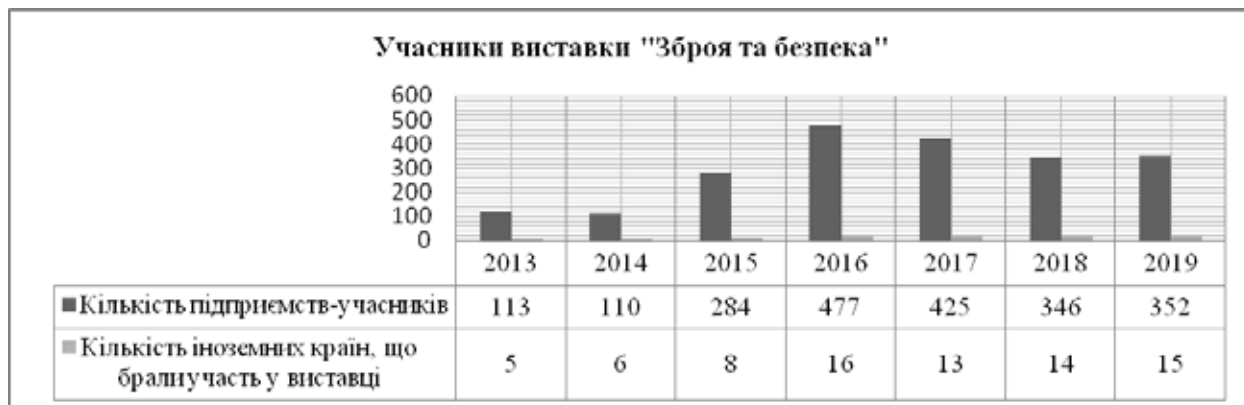
Рис. 4. Динаміка учасників міжнародної виставки «Зброя та безпека»*

З 2004 року Кабінетом Міністрів України ініційовано проведення міжнародної виставки «Зброя та безпека», яка щорічно відбувається у м. Києві. Проведення виставки є не лише демонстрацією військово-технічної