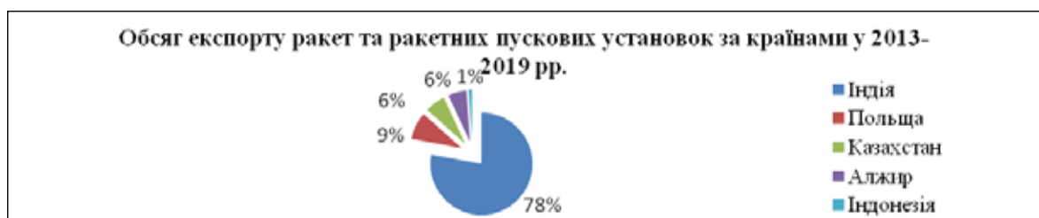
Рис. 1. Обсяг українського експорту ракет і ракетних пускових установок за країнами у 2013-2019 роках*

Угоди України про військово-технічне співробітництво між Індією, Єгиптом, Алжиром і Катаром вже укладено. Таку ж угоду між Україною та Саудівською Аравією укладено в січні 2020 року [9]. Натомість співробітництво України між Австралією та Південною Кореєю залишається неузгодженим. Україні необхідно інтенсивніше працювати в цьому напрямі, адже імпорт товарів військового призначення Австралії, наприклад, за останні 5 років зріс на 40% [8].