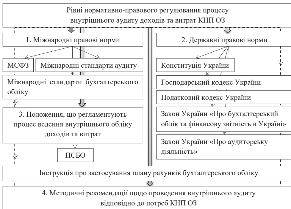
Рис. 2. Структурно-змістивна схема нормативно-правового регулювання процесу внутрішнього аудиту доходів та витрат КНП ОЗ