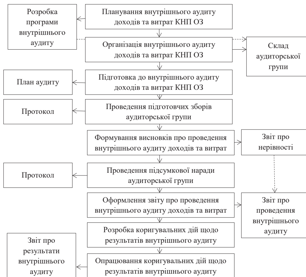
Рис. 4. Алгоритм проведення внутрішнього аудиту доходів та витрат КНП ОЗ