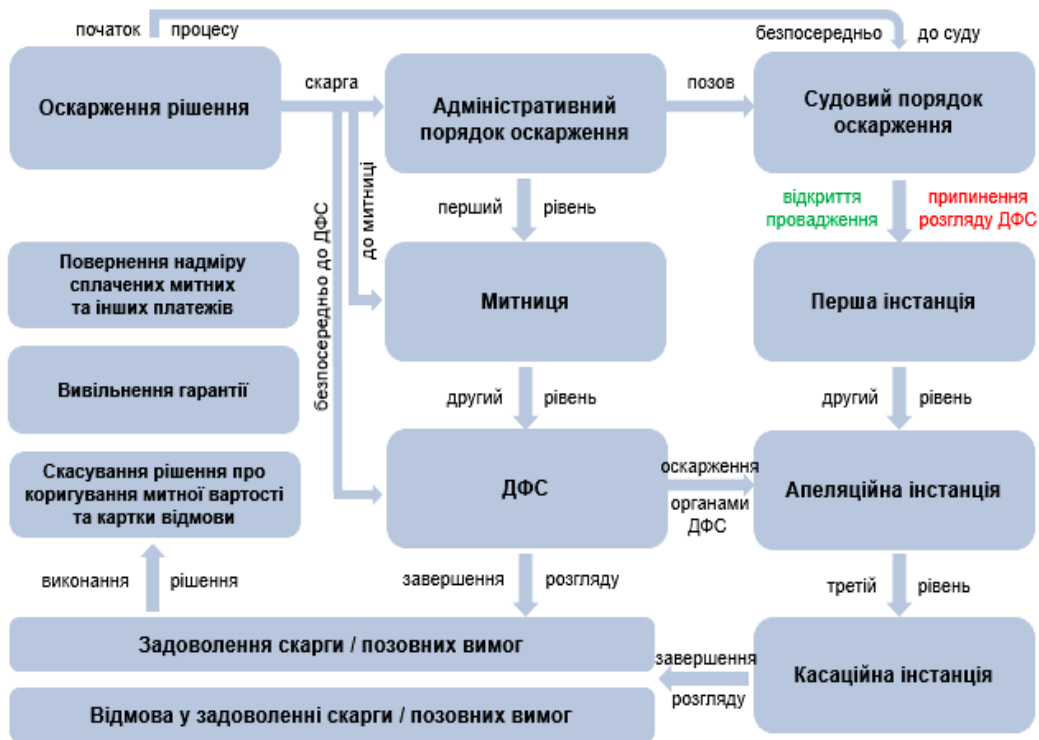
Рис. 2. Схема оскарження рішень про коригування митної вартості товарів

При цьому, якщо рішення, дії або бездіяльність органу доходів і зборів або його посадової особи одночасно оскаржуються до органу (посадової особи) вищого рівня та до суду, суд відкриває провадження у справі, розгляд скарги органом (посадовою особою) вищого рівня припиняється [5, ч. II ст. 29]. Отже, законодавство визначає адміністративний та судовий порядок оскарження рішень, дій або бездіяльності органів доходів і зборів. Відповідний процес у загальному вигляді можна зобразити так (рис. 2).