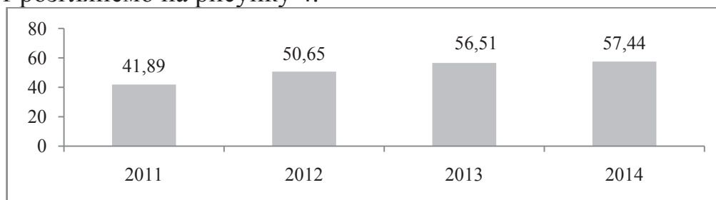
Рис. 4. Динаміка видатків місцевих бюджетів на соціальний захист і соціальне забезпечення в Україні, млрд. грн.

Динаміку видатків місцевих бюджетів в Україні на соціальний захист розглянемо на рисунку 4.