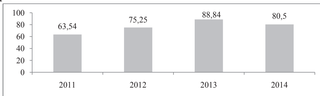
Рис. 3. Динаміка видатків Державного бюджету на соціальний захист і соціальне забезпечення на Україні, млрд. грн.

Аналіз динаміки видатків Державного бюджету на соціальний захист і соціальне забезпечення в Україні (наведена на рисунку 3), також свідчить про скорочення фінансування у 2014 р. в співставленні з 2013 р.