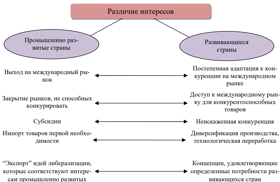
Рисунок 2: Перспективы мировой торговой системы после министерской конференции на о. Бали

обязательном порядке. Данное условие способствует пользованию услугами внутренних клиринговых учреждений, которые опасаются, что это приведет к потере бизнеса и, следовательно, к снижению уровня занятости. Это, в свою очередь, оказывает негативное влияние на подоходный налог и отчисления, так как все мы пополняем государственную казну. К тому же, существует следующее мнение: нет никакой гарантии того, что этот утраченный доход будет компенсирован транснациональными компаниями по причине того, что некоторые из них могут быть вовлечены в схемы по уклонению от уплаты налогов или в злоупотребление трансфертным ценообразованием.